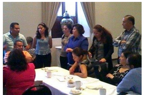
Health care providers in Mexico.

Gynuity imparte capacitación y normalmente se lleva a cabo conjuntamente con investigación en la prestación de servicios para mejorar calidad, efectividad, accesibilidad y/o cobertura de los programas. En abril de 2016, Gynuity celebró el 15 o aniversario de la introducción del aborto con medicamentos en Túnez con personal de Office Nationale de la Famille et de la Population , socios clave para la implementación y extensión del método a nivel nacional en ese país. En la ciudad de México, gracias en parte a los esfuerzos realizados por Gynuity desde 2007, más del 80% de los procedimientos de aborto de primer trimestre son con medicamentos. Se ofrece mifepristona y misoprostol a pacientes ambulatorias con hasta 10 semanas de embarazo en todas las clínicas de la red del sector público de la Secretaría de Salud de la Ciudad de México.